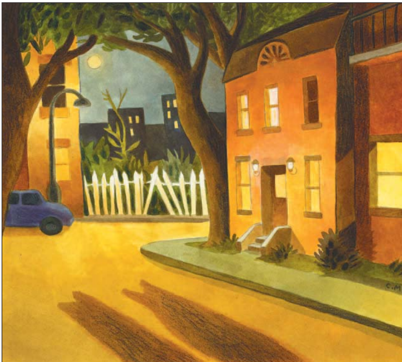
illustration : Caroline Merola

Décidément, cette fille n'a peur de rien. Je n'ose pas lui dire que je préférerais rebrousser chemin, que je ne me suis jamais rendu seul au bout de la ruelle, encore moins lorsque la nuit est tombée. Mais, j'ai trop peur de retourner seul, alors je continue à faire semblant d'être brave.