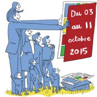
ILLUSTRATION : CYRIL DOISNEAU