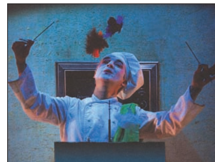
Le Temps des muffins.