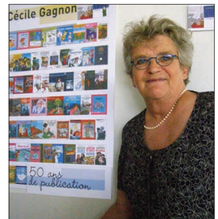
Photos couleur, prises par Daniel Sernine lors de la fête du 8 juin.