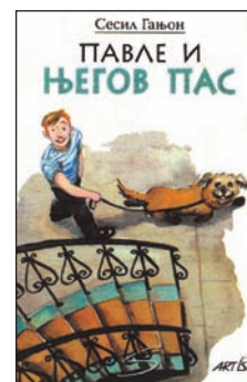
Le chien de Pavel, édition serbe.