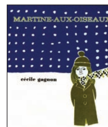
Prix de la Province de Québec, 1970.