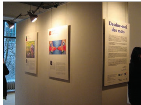
Le vernissage, dans les locaux d'Illustration Québec.