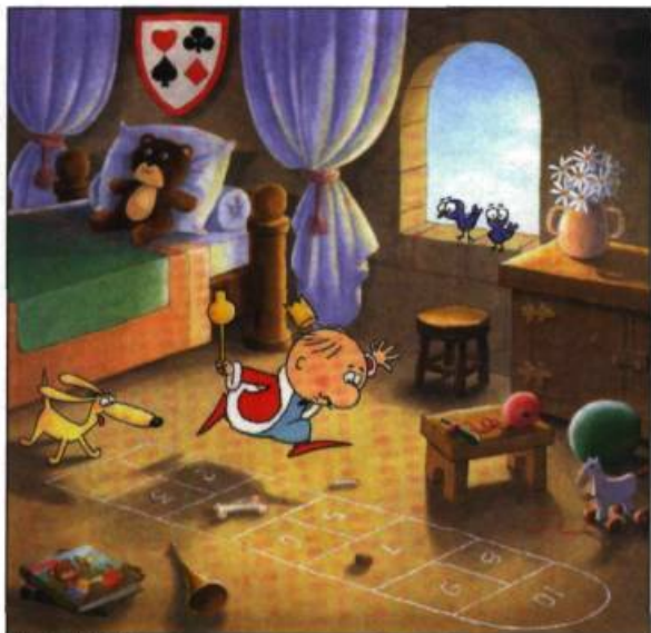
Le Roi Gédéon

La manifestation ludique du petit monarque dessiné par Raymond Lebrun pour l'histoire de Pierrette Dubé, Le Roi Gédéon