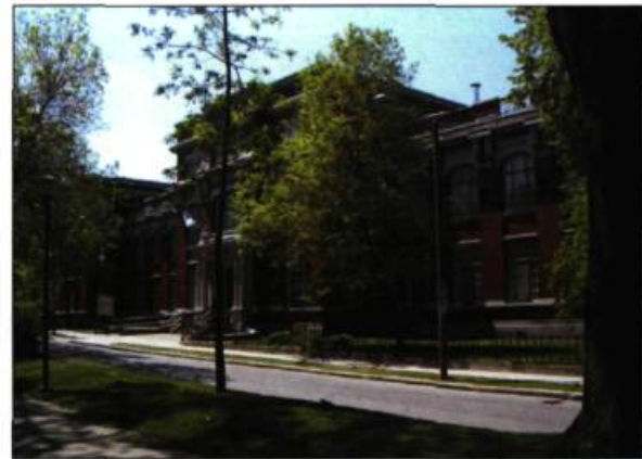
Le CQPV a ses bureaux au Centre Alyne-Label, boulevard Langelier, à Québec.

moriale. Les grands-parents de tous les pays du monde de tous les siècles passés ont fait ça.»