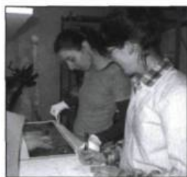
Des finissantes en techniques de muséologie du cégep Montmorency préparent des originaux et réalisent les encadrements.

À l'entrée, une vitrine hommage est consacrée à Michèle Lemieux, artiste polyvalente symbolisant les communautés québécoise et allemande, autour du l'album Nuit d'orage , où on pourra admirer les originaux des illustrations ainsi que les maquettes du film d'animation tiré du livre. Puis, un labyrinthe de bannières colorées mène à la salle suivante, où le visiteur est appelé à vivre une expérience centrée sur les mots, par une sélection d'extraits de textes qui, par leur sujet, leur forme littéraire, sont des propositions rendant hommage à l'audace des auteurs et des éditeurs du milieu de la littérature jeunesse québécoise. Il est invité à savourer les extraits qu'il lit, qu'il entend, à établir des liens, à faire des associations, et lui-même à jouer avec les mots. Dans une autre salle, consacrée à la relation texte-image, le visiteur participe à des jeux permettant de mesurer son audace à celle des créateurs (par exem-