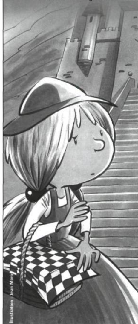
Illustration : Jean Morin

une petite fée avec un cœur grand comme ça!