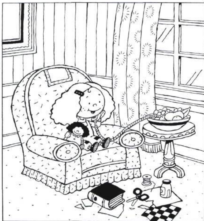
Illustration : Marc Auger

L'auteure a quarante-et-un ans, mère d'un garçon de dix ans et conseillère municipale à Saint-Marc-sur-Richelieu. Née à la campagne d'un père flamand et d'une mère québécoise, elle a vécu son enfance entourée de neuf frères et sœurs.