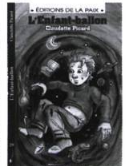
L'Enfant-ballon Claudette Picard