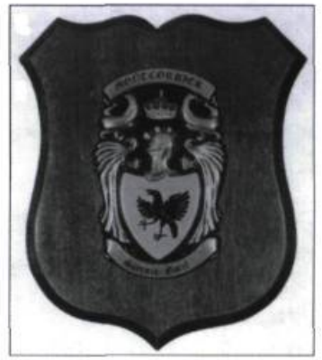
Armoiries des Montcorbier