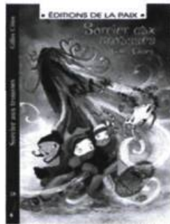
Sorcier aux trousseaux Gilles Côté