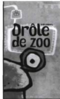
Drôle de zoo Claire Obscure