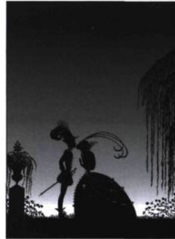
Le film Princes et princesses .