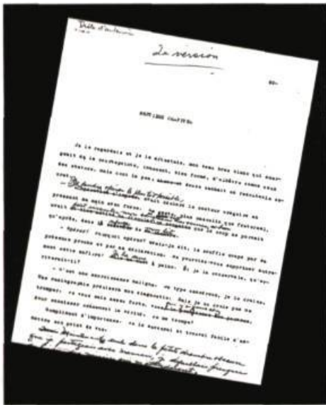
Début du chapitre 7 de Drôle d'automne , deuxième version