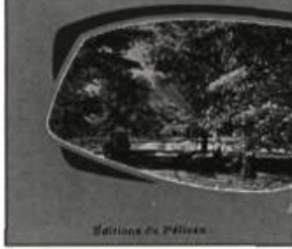
Éditions du Pélican, 1961

«La rue la plus banale se parait de poésie, ses maisons, pareilles, sous leurs capuchons, à des miches pansues, prêtes pour le four. Les voitures, garées la veille le long des trottoirs, émergeaient tout juste des amoncellements échaudés par les chasse-neige qui repoussaient patiemment, avec un grondement des entrailles, la lourde moisson blanche.»