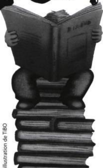
illustration de TIBO