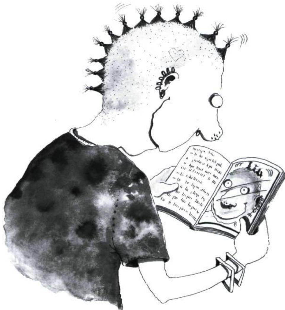
Illustration: Dominique Jolin