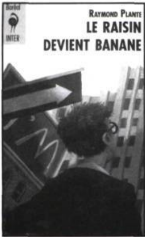
Le titre et l'illustration sont deux excellentes accroches signées Raymond PLANTE et Stéphane POULIN.

Le lecteur se dit : « J'ai lu les trois premiers... Moi aussi, je travaille chez McDonald's... Puis je voudrais bien prendre un appartement... Je l'achète! »