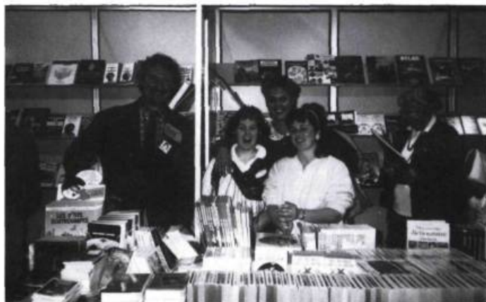
Même s'il change de maison d'édition, l'écrivain de métier conserve SA clientèle.

Pour qu'un livre captive le lecteur, il faut d'abord que le lecteur s'intéresse au livre. Ce dernier, en tant que produit de consommation, doit être acheté ou emprunté par le lecteur lui-même ou par l'intermédiaire d'un adulte. Cela suppose que les professionnels du livre ont tout fait pour que le livre accroche le lecteur et le garde captif. En lisibilité, cette étape primordiale comporte trois volets : l'accroche, le circuit de lecture et le verrouillage. Comme en publicité. N'oublions pas que les jeunes vivent dans un univers de vidéoclip où celui-ci joue un rôle prépondérant.