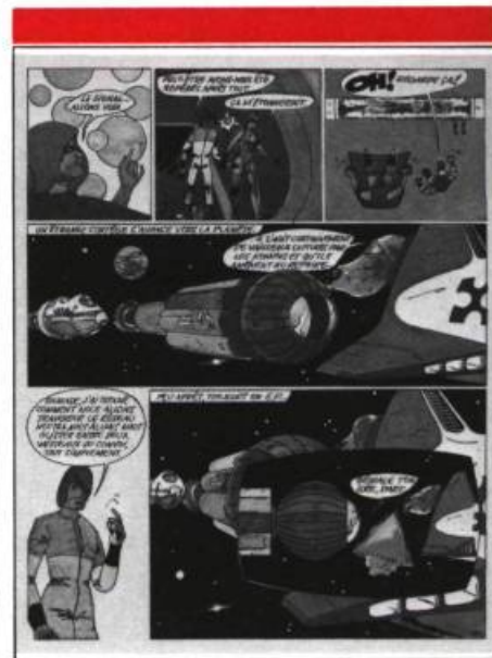
Illustration de Robert Héner tirée de l'album Le grand silence

talent; tant et si bien que le lecteur poursuivra sa lecture jusqu'à la fin sans ennui. Il faut signaler la mise en pages dynamique qui agrément la lecture.