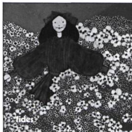
Illustration de Louise Méthé, tirée des Saisons de la mer , Collection du Goéland, aux Editions Fides, Montréal, 1975.