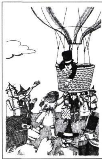
L'enchanteur du pays d'Oz , de Marie-Andrée Warnant-Côté, Montréal 1977, les Editions Héritage, Collection Pour lire avec toi. Illustrations de la page couverture en couleur et 10 illustrations intérieures en noir et blanc.