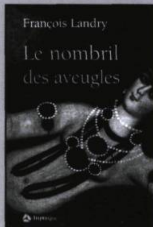
FRANÇOIS LANDRY Le nombril des aveugles roman, 267 p., 22 $

Nos yeux sont obstrués. Nos sommes presque aveugles. Tant de visions y ont déposé leurs cendres. À travers une mosaïque de regards, celui de l'enfant rêveur, de l'homme amoureux, du gardien de phare, du vieillard et même du chat, le poète veut traduire les textures et les transparences du monde. Pour que la convergence des points de vue recompose le regard initial posé sur la vie.