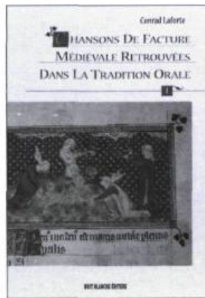
CHANSONS DE FACTURE MÉDIÉVALE RETROUVÉES DANS LA TRADITION ORALE Tomes I et II (sous coffret) Conrad Laforte 955 pages 75 $