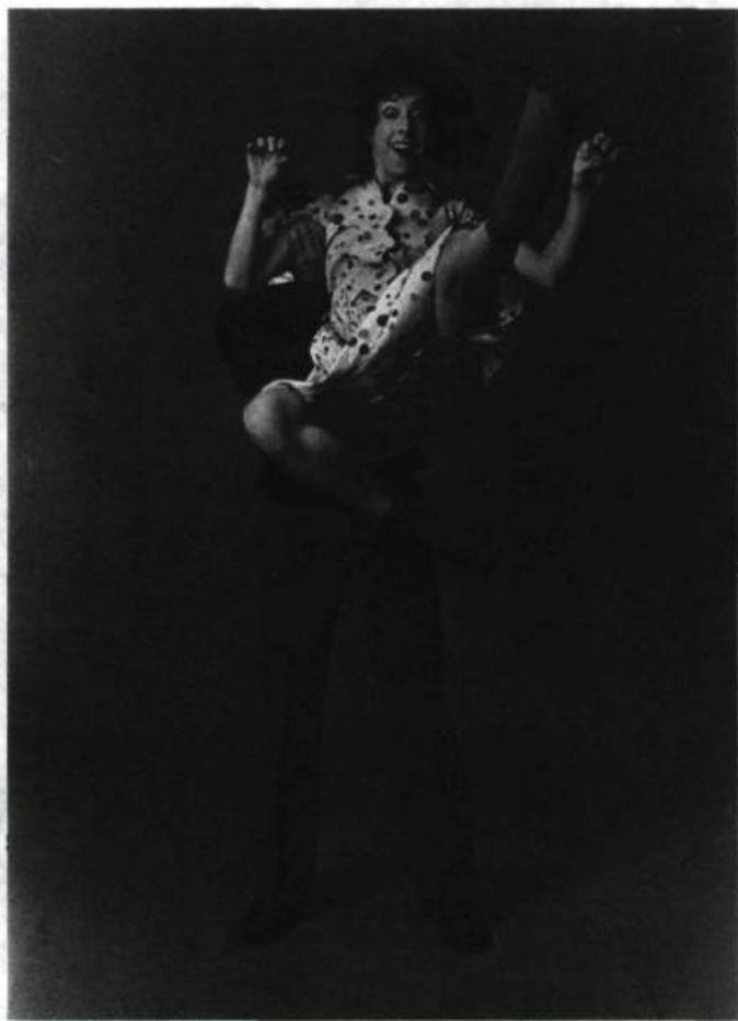
Une scène de La grandeur du geste et des passions .