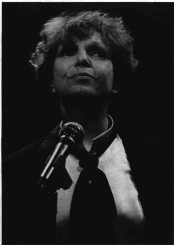
Monique Leyrac interprétant Nelligan.