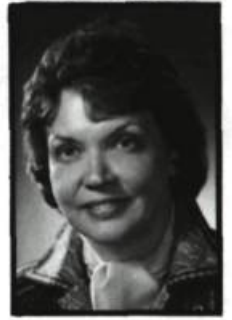
par Gabrielle Poulin