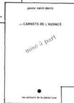
Mise à part 32 p., $3.50