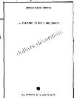
Dollars désormais 28 p., $3.50