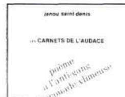
Poème à l'anti-gang 28 p., $3.50