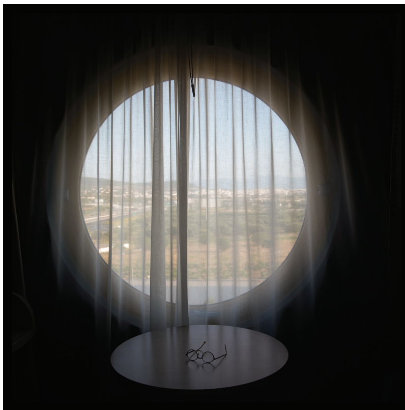
Fenêtre ronde, Athènes, Grèce, juin 2012

10. George Orwell, Politics and the English Language , Penguin Classics, 1945 : « To think clearly is a necessary first step towards political regeneration : so that the fight against bad English is not frivolous and is not the exclusive concern of professional writers. » (Ma traduction.)