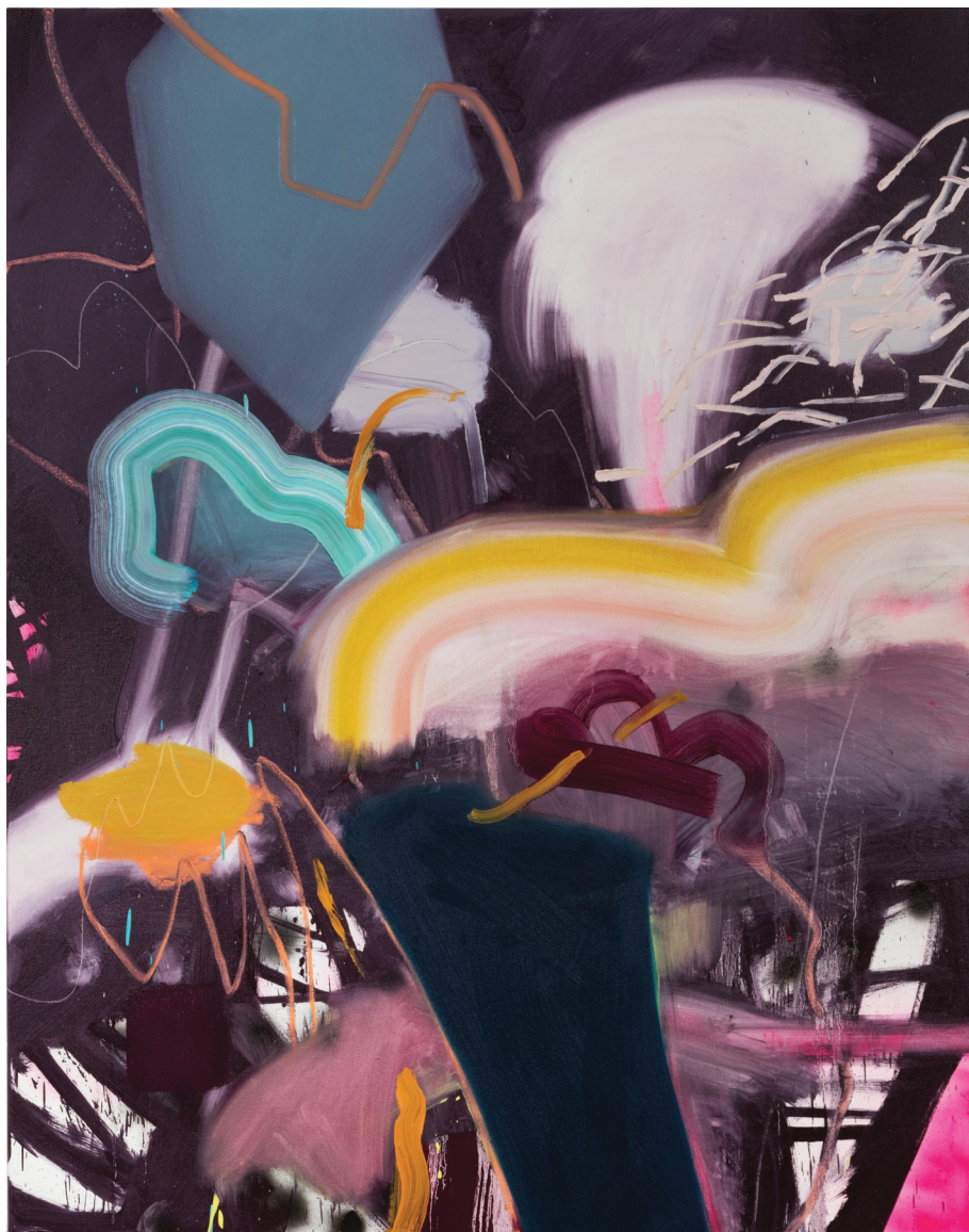
Begin and End (Together, in Purple) , 2016. Huile et aérosol. 60 x 48 pouces.

nées d'activité dans des centres d'artistes influencent probablement ce désir. J'éprouve le besoin d'encourager ces liens qui nourrissent la communauté artistique. Puisqu'on m'a généreusement offert cette possibilité, j'ai naturellement envie de redonner aussi. » Lefort a travaillé pendant cinq ans, en tant qu'artiste et commissaire, au centre Axénéo7. Les meilleurs artistes au pays ont presque tous fréquenté ce genre de centres, m'explique-t-elle, car ceux-ci permettent à chacun de mieux définir son propos et de se mettre à risque en explorant de nouvelles avenues.