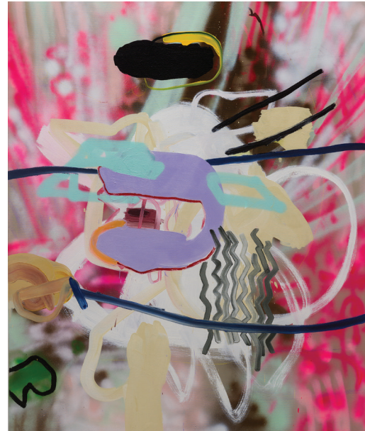
Everything Collides (in the Future) , 2015. Huile et aérosol sur toile. 60 x 48. Huile et aérosol sur mousse polyuréthane.

culière de jouer avec l'espace engendre des univers qui semblent presque réels.