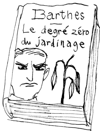
L'éditeur avait insisté pour faire des suites.

Je me souviens que nous avons mal pris la déclaration sur le « vote