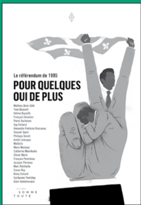
Le référendum de 1995. Pour quelques oui de plus Collectif Somme toute

Venez assister à nos conférences à Montréal ou à Québec et procurez-vous l'un de ces quatre livres dans une librairie indépendante.