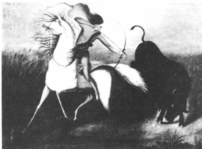
Anonyme américain (env. 1830). Le Chasseur de buffles , Musée de Santa Barbara. Reproduit de Psychologie de l'art , André Malraux, Albert Skira éditeur, Paris.

Il y a quelque chose, dans le geste d'art, dans l'art, qui va jusqu'au bout de lui-même. Il en va semblablement dans le comportement de la matière. Tenons-nous-en pour l'instant à un certain art dynamique, plus facile à lire qu'un autre à ce point de vue, tout spécialement par son côté dessin. Il est absolument nécessaire que le geste du dessinateur désobéisse, selon sa réalité propre de geste ; je dirais presque : selon sa mécanique propre. Il faut qu'il fasse tout ce qu'il a à faire. Il faut que ce que l'artiste cherche soit confié à cette liberté même. Il est important que le trait aille de lui-même, mandaté par le peintre, explorer l'inconnu.