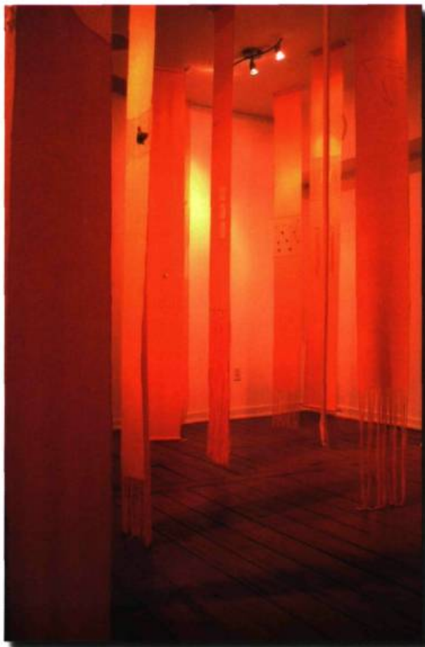
EN HAUT ET EN BAS Détail de La moisson II 12 po X 11 pi Tissage de coton sculpté — objets trouvés 2007