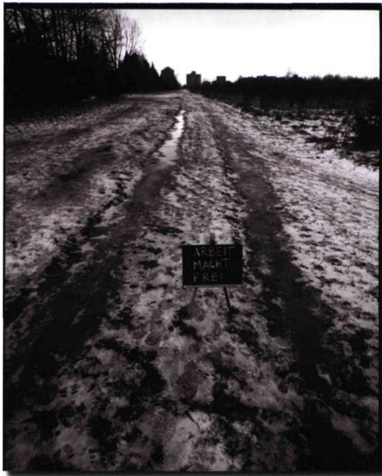
EN HAUT Little boy Environ 20 X 30 po Photo numérique, 2007