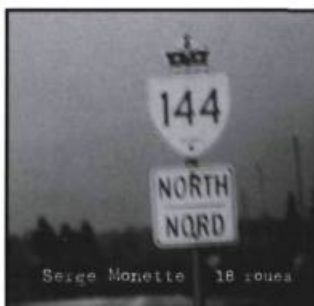
SERGE MONETTE - 18 roues