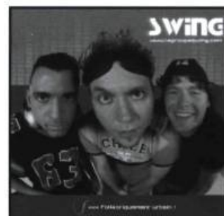
SWING - Folkloriquement urbain