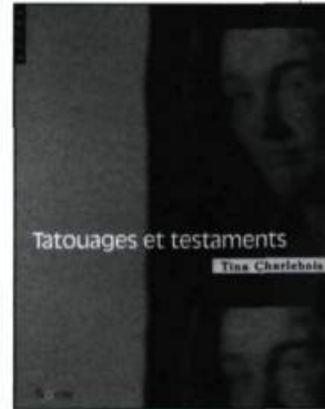
Tina Charlebois, Tatouages et testaments , Ottawa, Le Nordir, collection «Actes premiers», 2002, 75 pages.

Souvent, on a l'impression de ne plus distinguer l'espace physique de l'espace psychique, le temps du réel du temps du rêve. L'imaginaire du personnage est toute sa vie. Le paysage — son quartier, ses ruelles, son banc, son jardin — est lieu d'action : «Il a poussé hier sa promenade jusqu'aux abords / d'un boisé, lui qui ne sort jamais des rues de son quartier / [...] // Un sentier est venu à sa rencontre» (p. 43). Ses explorations deviennent physiques : «En accord avec le destin de cette sente, il a laissé son / corps le mener jusqu'à l'épuisement» (p. 43). Il n'est pas seul, mais solitaire. Les autres, se pointant de temps en temps dans le dessin de son rêve, ne le comprennent