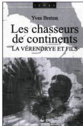
Les Chasseurs de continents: La Vérendrye et fils , roman, les Éditions L'Interligne, Collection «Paysages», 1999, 147 pages.

autour des campements et écouta Martin jouer du violon» (p. 72). Pour varier la formule stylistique, l'emploi du présent de narration semble tout indiqué. Non seulement s'allie-t-il naturellement au passé simple, mais surtout viendrait-il ajouter de la vie à l'action.