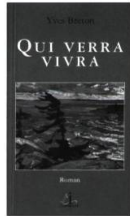
Qui verra vivra: L'Initiation à la vie et les fabuleuses découvertes de Martin Talbot en Nouvelle-France (1658-1684) , roman, les Éditions L'Interligne, Collection «Paysages», 1998, 163 pages.

Le passé simple est un temps littéraire qui convient bien au récit et le romancier l'utilise abondamment avec une belle maîtrise, sans bavure. Il est exceptionnel de relever la faute suivante: «des Iroquois fondèrent sur le groupe» ( Qui verra vivra , p. 110). Il s'agit bien du verbe fondre qui donne «fondirent». L'emploi fréquent de la tournure impersonnelle «l'on» semble toutefois moins indiqué dans le récit: «L'on navigua des heures durant, l'on fit de petits portages, navigua à nouveau, campa, chassa, pêcha, se raconta des anecdotes, examina des cartes, explora les territoires