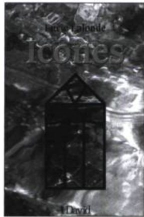
Lucie Lalonde, Icônes , poèmes, Orléans (Ontario), Éditions David, 1999, 154 p.

La richesse picturale de certaines photos est telle que l'on a du mal à croire au naturalisme parfait des clichés. On est tenté de supposer une aide esthétique. Inquiète quant au destin de la conscience «et quand nous serons terre muette/qui nommera» (p. 60), l'équipe d'artistes est occupée à créer «dans le cimetière de nos mots/ [le] vivier de l'alphabet minéral» (p.61). C'est là le projet symbolique des auteurs. ●