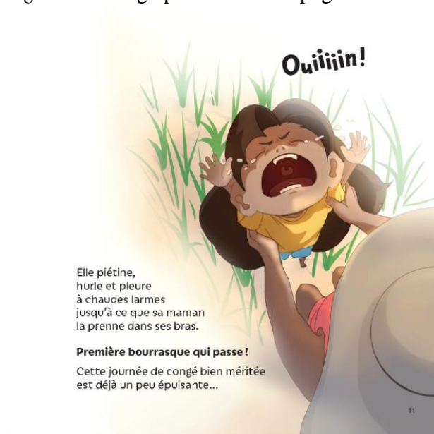
Figure 3. Congé pour maman – page 11

Enfin, voici un exemple de question de clarification d'une expression imagée, employée à cinq reprises dans l'histoire chaque fois que Sophie pleurait :