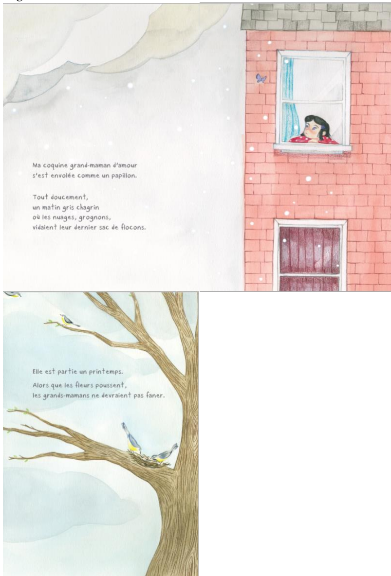
Figure 5. La boîte aux belles choses