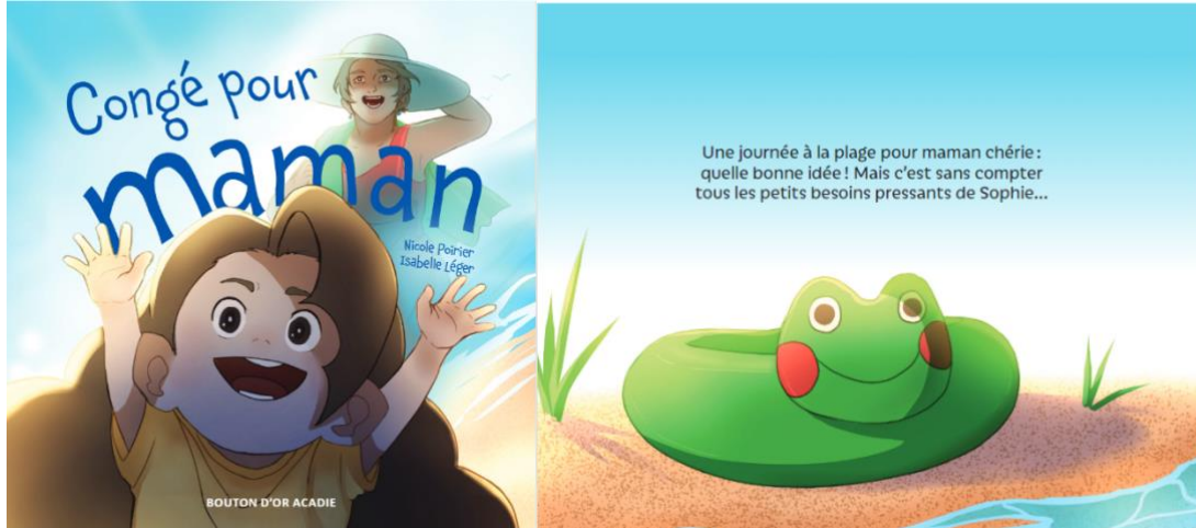
Figure 1. Congé pour maman – page couverture et quatrième de couverture

Pour toutes les questions de prédiction, les enfants entendront cette rétroaction : « Bravo! Tu as fait une prédiction intéressante. Allons voir ce qui va réellement se passer. »