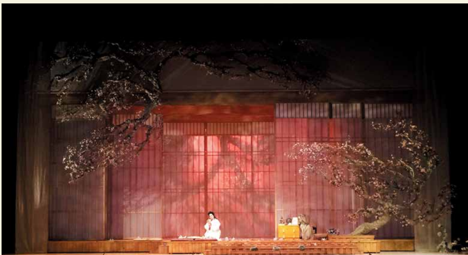
Madama Butterfly de Giacomo Puccini, mise en scène par François Racine (Opéra de Montréal), présentée à la salle Wilfrid-Pelletier de la Place des Arts en septembre 2015.