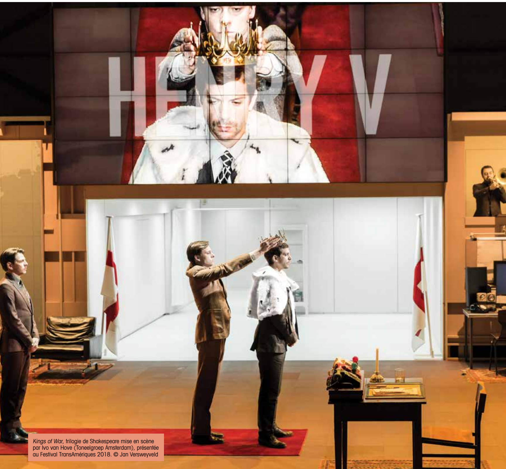
Kings of War , trilogie de Shakespeare mise en scène par Ivo van Hove (Toneelgroep Amsterdam), présentée au Festival TransAmériques 2018. © Jan Versweyveld