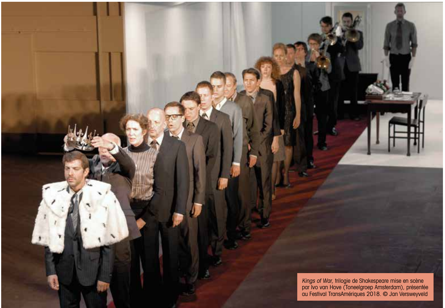
Kings of War , trilogie de Shakespeare mise en scène par Ivo van Hove (Toneelgroep Amsterdam), présentée au Festival TransAmériques 2018.