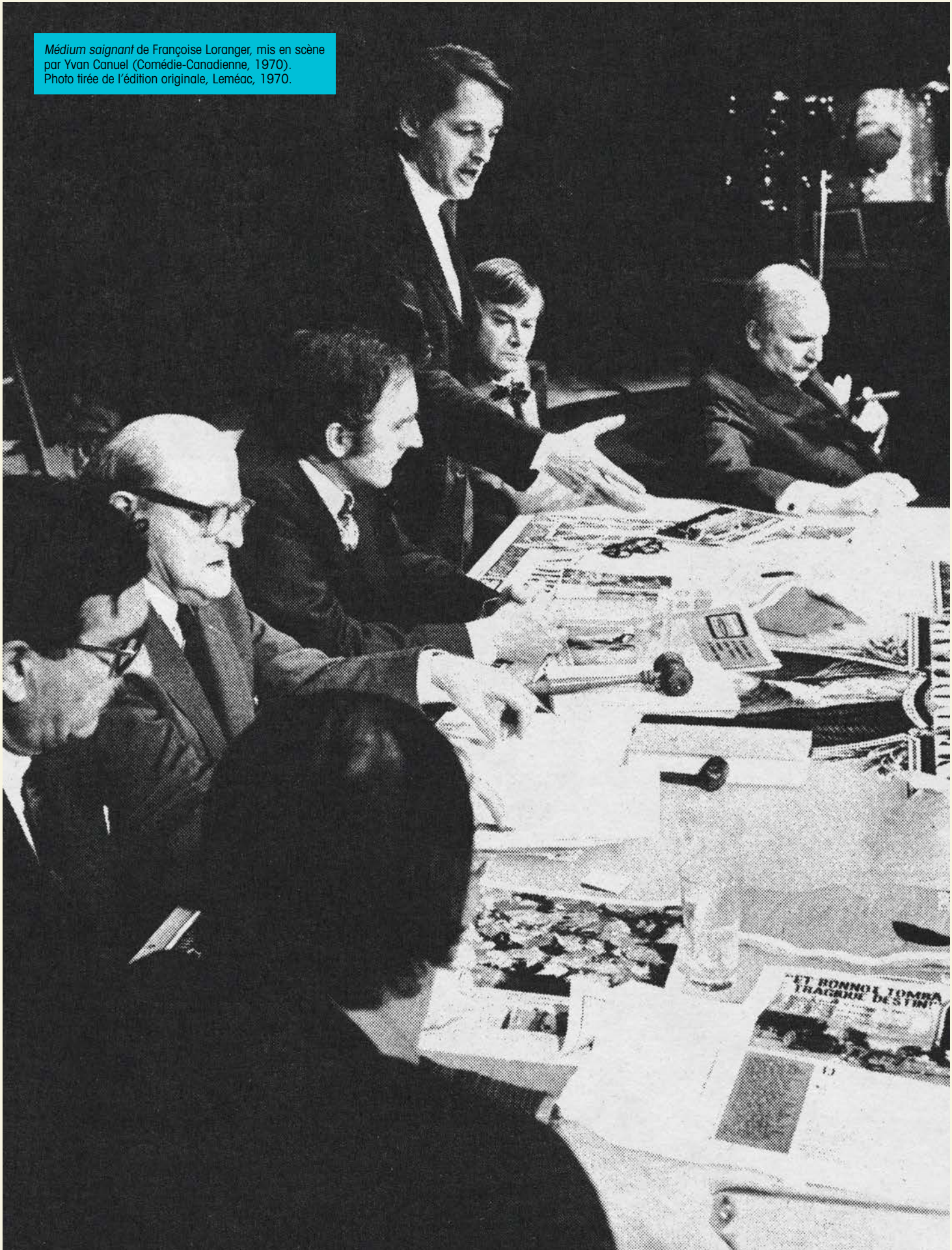
Médium saignant de Françoise Loranger, mis en scène par Yvan Canuel (Comédie-Canadienne, 1970).