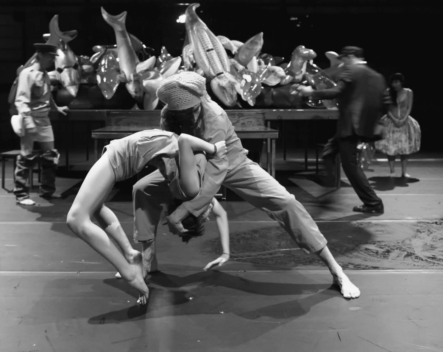
Place du marché 76 de Jan Lauwers (Needcompany, 2012).

Die traurigen Väter lassen sich verkaufen und klopfen sich auf die Schultern.