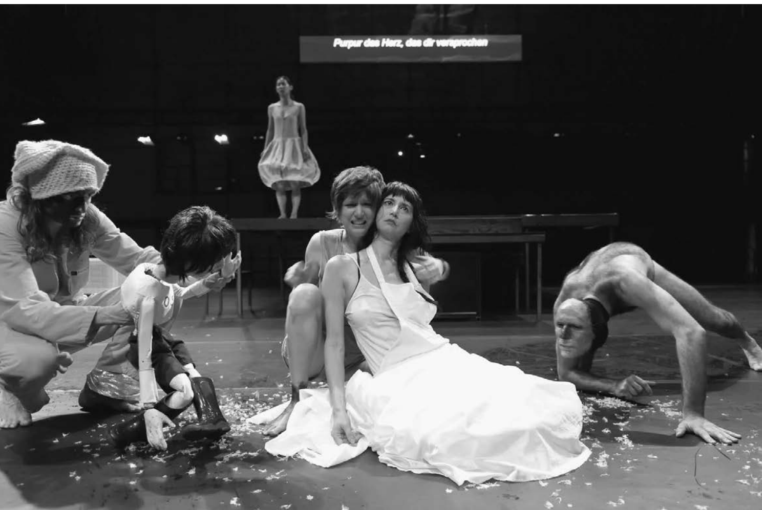
Place du marché 76 de Jan Lauwers (Needcompany, 2012).

Qu'est-ce que la langue française évoque pour toi ?