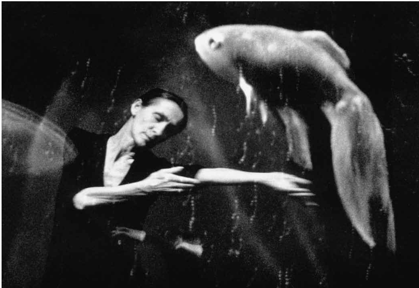
Pina Bausch dans sa pièce Danzón, créée en 1995 à l'Opernhaus de Wuppertal.

Selon cette perspective, sa persistance à interroger le passé avec insistance est souvent interprétée comme un processus visant à expier un legs trop lourd à porter. Dans le questionnement qui fait le propre de sa démarche, dans