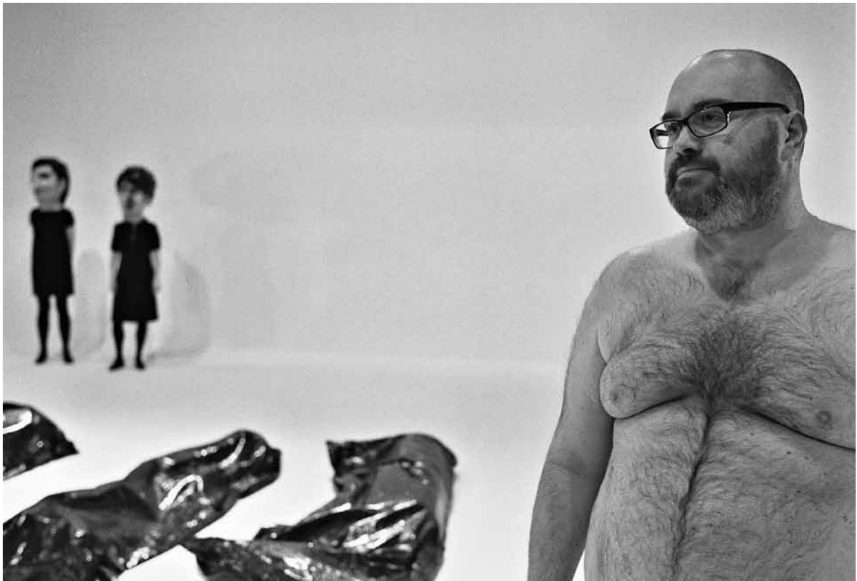
Capital confiance, création collective présentée en mars 2012 à l'Espace Libre par Transquinquennal et le Groupe TOC (Belgique).