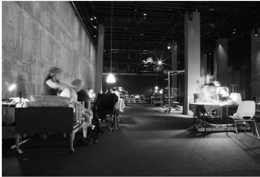
ZOO 2011 de Gaëtan Nadeau et Rodrigue Jean (NTE, 2011).

D'autres, comme la couturière taciturne, le travesti, les monteurs de mouches, le malade 2 et les deux femmes qui l'accompagnent et dont on n'ose interrompre la routine privée, vont passer presque inaperçus, n'auront presque aucun contact avec le public ou, du moins, se laisseront aborder avec patience. Ils nous apparaîtraient trop « ordinaires », pas assez pittoresques, donc