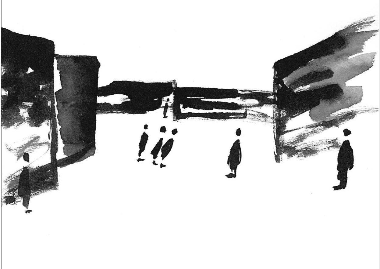
Dessin de Jean-Pierre Perreault. © Fondation Jean-Pierre Perreault.

Qu'est-ce qui permettra la réalisation concrète de ce plan stratégique, de cette nouvelle mission et de tous les projets qui l'accompagnent ? Qu'est-ce qui pourrait en gêner la réalisation ?