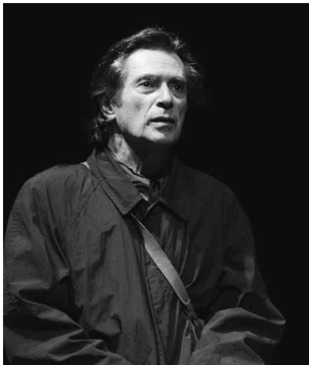
Premier amour de Beckett, interprété et mis en scène par Sami Frey. Spectacle du Théâtre de l'Atelier (Paris), présenté à l'Usine C en septembre 2010 à l'occasion du Festival international de la littérature.

L'automne dernier, Sami Frey et Jean-Marie Papapietro ont présenté à Montréal Premier amour , un court récit de Samuel Beckett qu'ils ont adapté pour le théâtre et mis en scène dans deux perspectives très différentes l'une de l'autre, mais ingénieuses et captivantes dans leurs manifestations respectives. Ce qui témoigne de la féconde polysémie des œuvres de Beckett interprétables à l'infini et rappelle la prédilection de Frey et de Papapietro pour l'art littéraire. Outre Cap au pire de Beckett, Frey a monté des textes de Pinter, Perec, Beauvoir et Sartre. Papapietro a lui aussi produit un Beckett – Comédie, Berceuse et Catastrophe – ainsi que des adaptations et pièces de Pinget, Brassäi, Kafka, Salvayre, Walser, Bernhard et Duras. Dans leur traitement de Premier amour , tous deux ont insufflé à la parole une fonction spécifique. Alors que Sami Frey a confié aux mots la création d'un personnage, Jean-Marie Papapietro a soutiré du personnage le rayonnement des mots.