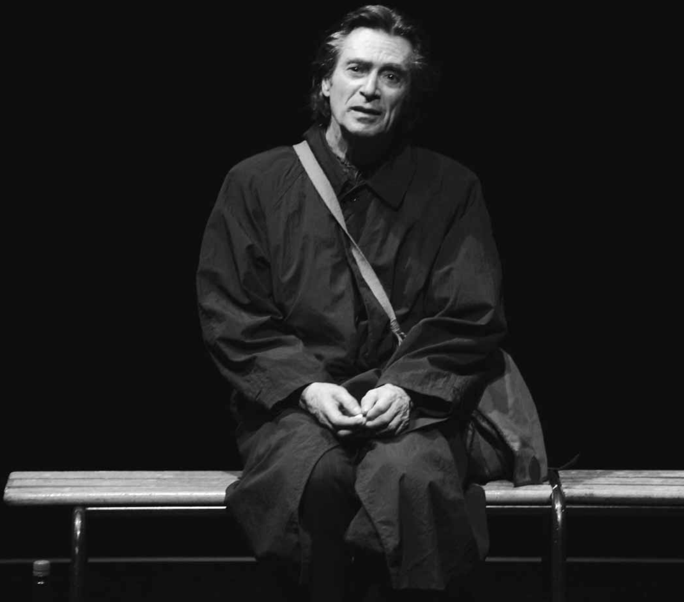
Premier amour de Beckett, interprété et mis en scène par Sami Frey. Spectacle du Théâtre de l'Atelier (Paris), présenté à l'Usine C en septembre 2010 à l'occasion du Festival international de la littérature.