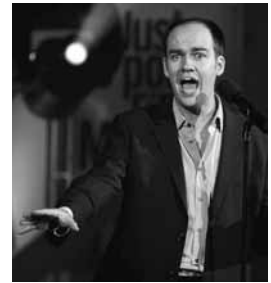
L'humoriste Guy Nantel.