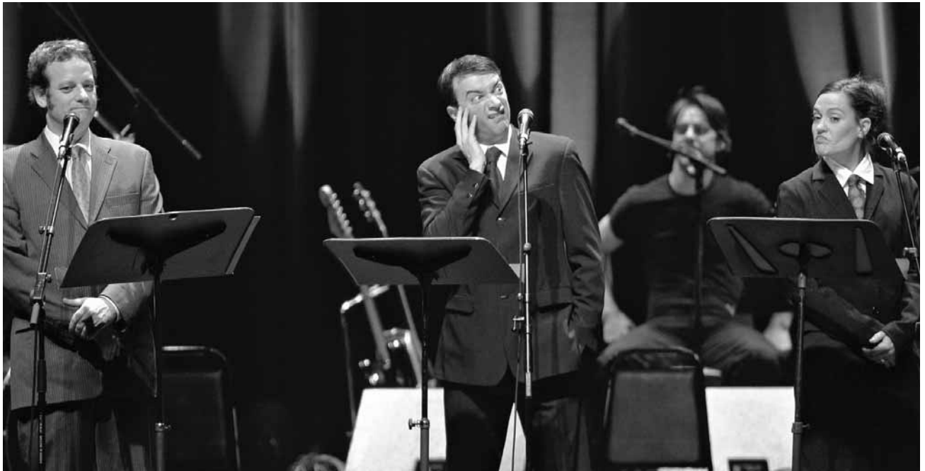
Les Zapartistes.