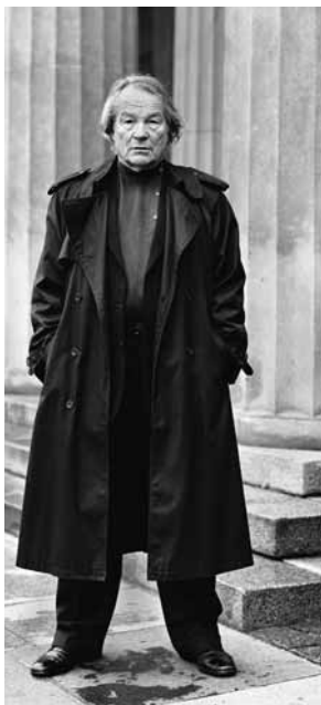
Peter Stein, Prix Europe pour le théâtre 2011.