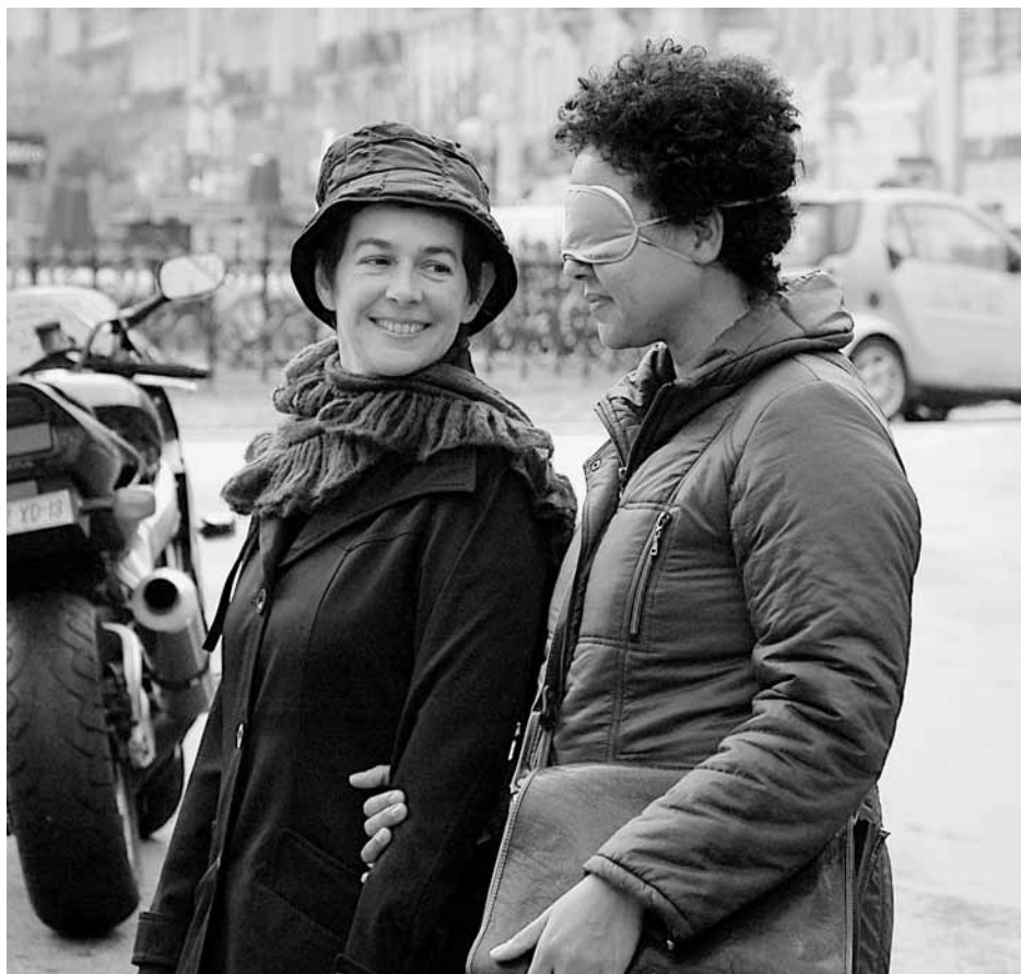
Tu vois ce que je veux dire ? , parcours à l'aveugle proposé par Martial Chazallon et Martin Chaput, présenté au FTA 2010.