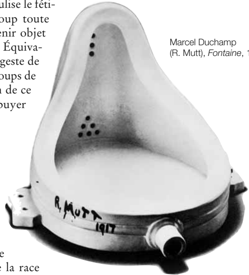
Marcel Duchamp (R. Mutt), Fontaine , 1917.

Ce que Breton appelait de ses vœux, la science en accouche le 16 juillet 1945 dans le désert du Nevada, non loin de la petite communauté de Los Alamos. Mais la « beauté convulsive » s'avère consternante : l'explosion de la bombe atomique introduit dans le réel une menace objective si grave, si globale qu'elle dépasse les divagations les plus démentes. Voici la matière subvertie en son foyer même, et Subversion aspirée dans le néant solaire.